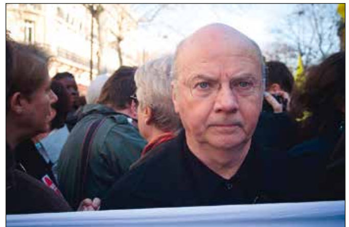
Jacques Gaillot in 2007.

De tekst werd gepubliceerd als bijlage bij "Nieuwsbrief Evangelie Levensnabij", 28 ste jaargang, nr. 3, 2016.