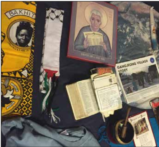
Beeld van het Catholic Nonviolence Initiative

Aan het slot van de conferentie over Geweldloosheid en Rechtvaardige Vrede, die plaats had van 11 tot 13 april 2016 in Rome, namen de deelnemers een verklaring aan. De bijeenkomst was een initiatief van Pax Christi International, de Pauselijke Raad voor Rechtvaardigheid en Vrede en verschillende andere katholieke organisaties.