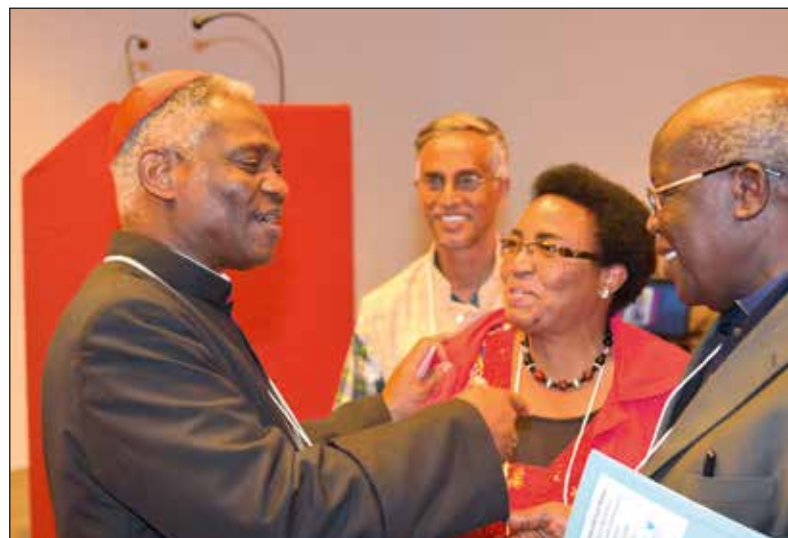
Kardinaal Turkson, die de boodschap van de paus voorlas, met enkele deelnemers aan de conferentie.

In elk tijdperk biedt de Heilige Geest de Kerk de wijsheid om de uitdagingen van zijn tijd aan te gaan. Als antwoord op de wereldwijde geweldepidemie, door paus Franciscus bestempeld als een 'wereldoorlog in fasen', zijn wij geroepen om beslissende actie te ondernemen, er hiervoor op te roepen, te bidden en te onderwijzen. Met onze gemeenschappen en organisaties kijken wij uit om samen met de Heilige Stoel en de wereldwijde Kerk verder te werken om de Evangelische geweldloosheid te bevorderen.