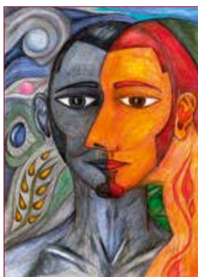
Coverbeeld: Kain en Abel (JoL, Kunstnet)