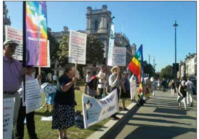
Bidden om vrede volstaat niet. Christelijke vredesorganisaties protesteren tegen de vernieuwing van Trident, het kernwapenprogramma van de UK.