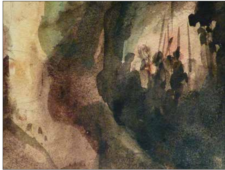
Studie voor Le Christ au Jardin des Oliviers (detail) – Eugène Delacroix

Had het geweld dan werkelijk het laatste woord? Het lijkt zo. Maar niets is wat het lijkt. Want nu zijn er ogen die opengaan, om te beginnen bij buitenstaanders. De eerste die hem ‘herkent’ in zijn ware gedaante is een Romeinse centurio: “Werkelijk, deze mens was Gods Zoon.” (15,39) 29 . De tweede die hem in zijn waardigheid herstelt, is een vooraanstaand lid van het sanhedrin, Jozef van Arimatea. Hij zorgt ervoor dat Jezus een graf krijgt (15,42-46), en distantieert zich daarmee duidelijk van zijn collega’s die erin geslaagd zijn om Jezus te laten vermoorden.