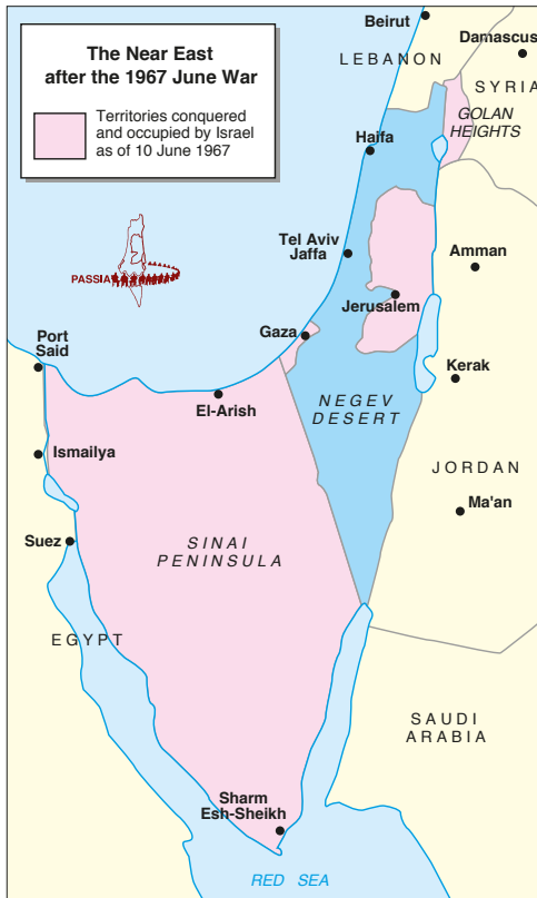
Israël na de juni-oorlog in 1967. In het roze de gebieden die sinds 10 juni 1967 door Israël bezet worden. Kaart: Palestinian Academic Society for the Study of International Affairs

door middel van geweld ontoelaatbaar is. In november 1967 aanvaardde de Veiligheidsraad resolutie 242, waarin Israël werd opgeroepen zich terug te trekken. De Engelse tekst vraagt “de terugtrekking van de Israëlische strijdkrachten uit gebieden die bezet werden tijdens het recente conflict”. De Franse tekst vraagt “de terugtrekking van de Israëlische strijdkrachten uit de gebieden die bezet werden tijdens het recente conflict”. Het ontbrekende lidwoord in de Engelse versie zette de deur open voor interpretatieverschillen over Israël’s terugtrekking uit bezet gebied.