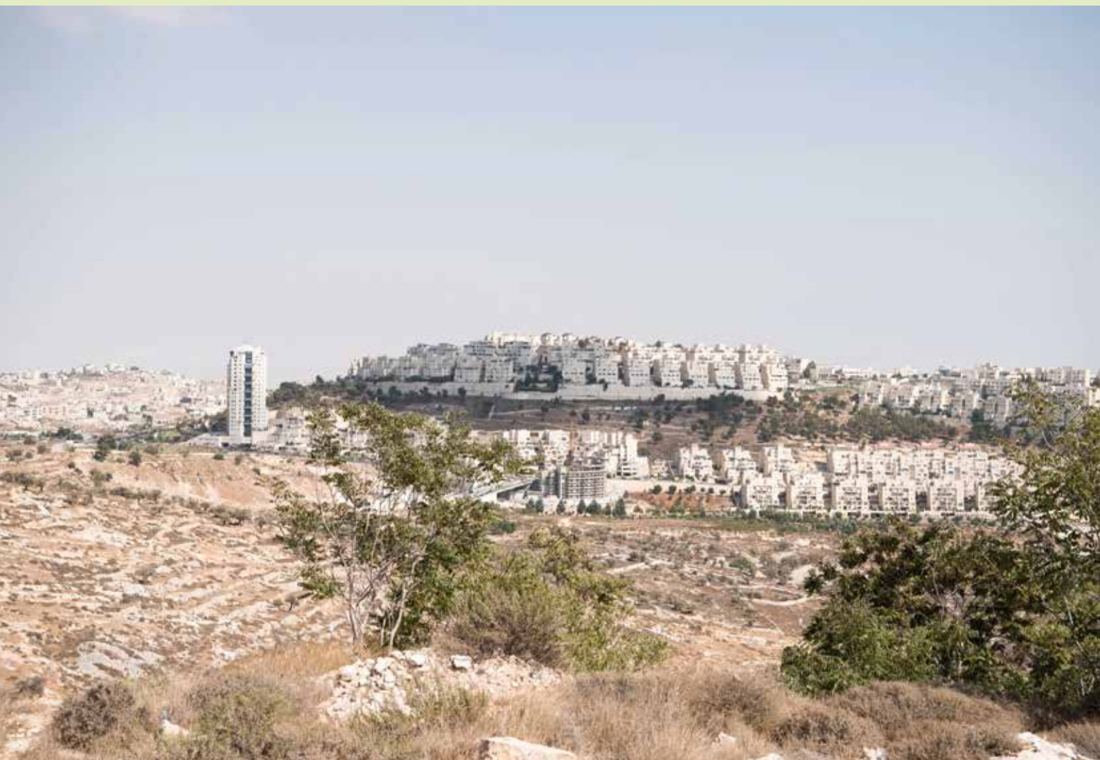
Nederzettingen op de Westelijke Jordaanoever.