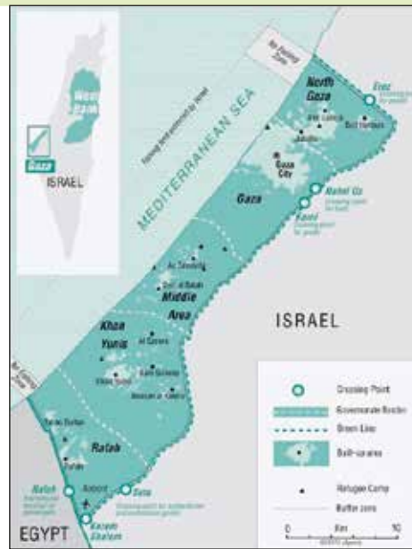
Gaza: totaal geïsoleerd van de rest van de wereld.

Het gebruik van geweld door het leger wordt sinds de start van de Tweede Intifada ook gezien als een legitiem preventiemiddel tegen terreur. De Israëliische ex-soldaten van Breaking the Silence beschrijven hoe ze ervan uitgingen dat elke Palestijnse man of vrouw verdacht was en een bedreiging vormde voor de veiligheid van Israëliische burgers. Hierdoor was het geoorloofd om, in het kader van contraterreur, een hele burgerbevolking via intimidatie zoals geweld aan controleposten, invallen in huizen en collectieve bestraffing af te schrikken. Ook het afscheiden van Palestijnen van Israël, van Palestijnse gemeenschappen onderling en het ontnemen van hun basisrechten is een manier om burgers te controleren en hun land te annexeren. 9 Door zijn militaire superioriteit en zijn ingenieuze bezettingssysteem kan Israël alle niveaus van het Palestijnse burgerleven controleren en zijn aanwezigheid constant duidelijk maken. De paradox is dat de bezetting voor een groot deel van de Israëliische burgers onzichtbaar is.