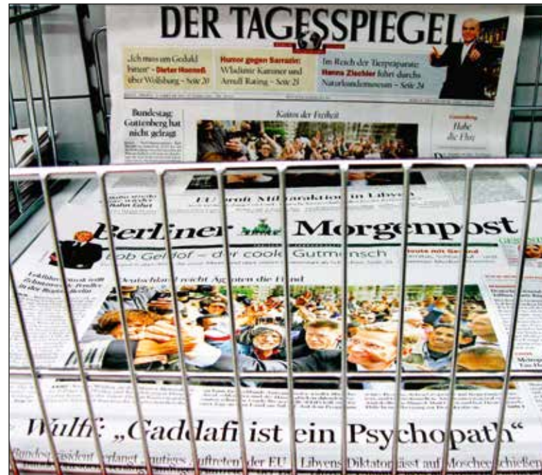
'Khaddafi is een psychopaat'. Berliner Morgenpost, 23 februari 2011.

Een post-mortemanalyse laat echter zien hoe de zgn. humanitaire interventie werd begeleid door oorlogspropaganda. Vanaf het begin werd Khaddafi's gedrag