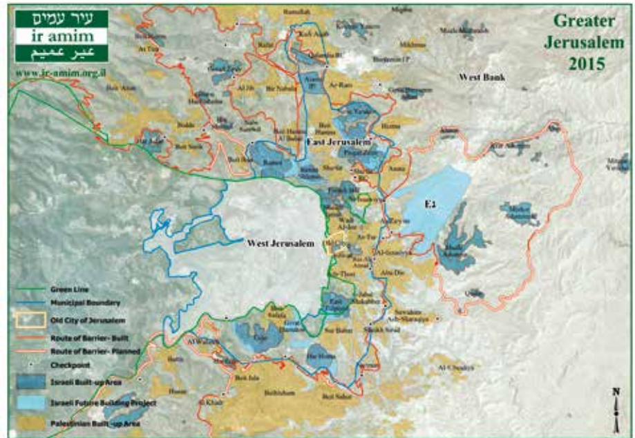
Greater Jerusalem in 2015. Kaart: www.ir-amin.org.il .

Na de illegale machtsovername van Hamas in de Gazastrook in 2007 riep Israël Gaza uit tot 'vijandig gebied' en isoleerde het de smalle kuststrook van de rest van de wereld. Het installeerde een draconische blokkade waarbij het de bewegingsvrijheid van personen en goederen vrijwel volledig aan banden legde. Tien jaar na het begin van de blokkade, waarin ook drie verwoestende conflicten plaatsvonden, lijkt de isolatie van Gaza permanent geworden.