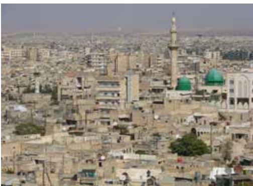
Coverbeeld: zicht op Aleppo vanuit de beroemde citadel, enkele jaren voor het begin van de opstanden en oorlog.