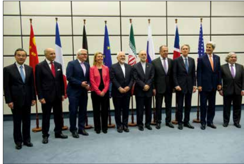
Officiële groepsfoto na het sluiten van de nucleaire deal met Iran. Hoge vertegenwoordiger voor Buitenlandse Zaken en Veiligheidsbeleid van de EU Federica Mogherini met de buitenlandministers op het VN-hoofdkwartier in Wenen, 14 juli 2015.

Terwijl Iran zich blijkbaar goed aan de afspraken houdt, knelt het schoentje dus aan de andere zijde: ook al omdat de verhoopte economische groei voor Iran door de afschaffing van de sancties slechts ten dele is uitgekomen. Dat heeft dan weer te maken met het feit dat veel westerse (en meer bepaald Europese) banken en bedrijven aarzelen om zich te engageren, omdat ze vrezen dat ze door hun activiteiten alsnog Amerikaanse wetten zouden overtreden, waardoor ze door de VS gestraft zouden worden. Komt daarbij dat de VS alle niet-nucleair gerelateerde economische sancties (die reeds langer bestonden) tegenover Iran in stand houdt. Aan Amerikaanse zijde heeft enkel Boeing een deal kunnen sluiten met Iran voor de hernieuwing van de vloot. Of dat alles volstaat voor president Rouhani om herkozen te worden, is onduidelijk. Conservatieve fracties in Iran hebben veel kritiek op de deal, niet alleen vanuit hun anti-Amerikaanse ideologie, maar veelal ook uit eigenbelang, omdat het sanctieregime hen goed