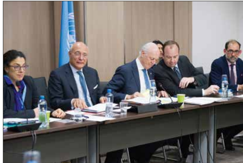
Steun aan de inspanningen van de VN-bemiddelaar: Staffan de Mistura (derde van links), speciaal VN-gezant voor Syrië, tijdens intra-Syrische onderhandelingen in Genève, 31 maart 2017.

De conclusie van 11.11.11 is duidelijk: de belofte om "niet als cowboys naar Syrië te gaan" bleef dode letter. In de praktijk beperkt de Belgische bijdrage zich tot het sturen van F-16's en