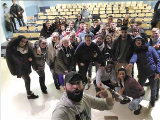
PeaceCraft bij Petrus & Paulus West in Oostende

opdat jongeren met verschillende meningen met elkaar in dialoog gaan.