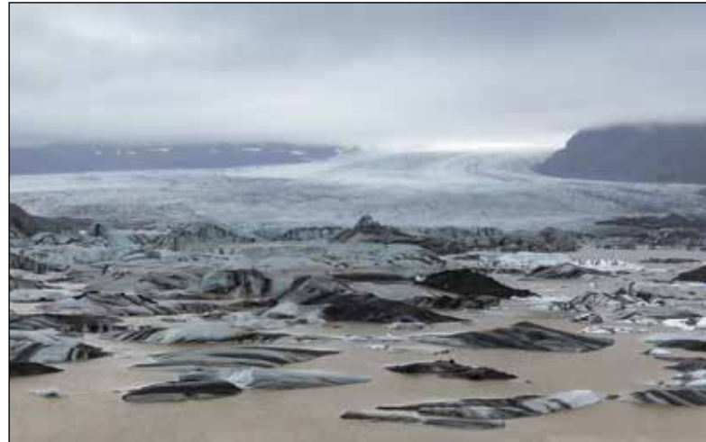
Is wordt water: terugtrekkende gletsjers door klimaatwijziging in IJsland

Ecokerk is initiatiefnemer van het Klimaatnetwerk.be en behartigt een langlopend project voor lokale groepen