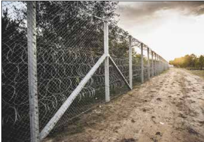
Grenshek tussen Hongarije en Servië, geplaatst tijdens de vluchtelingencrisis in 2015

Dit is de drijfveer van het werk dat wij tot op vandaag willen verderzetten. Vrede en rechtvaardigheid bevorderen, werken aan verzoening, vanuit een inspiratie gebaseerd op humane en christelijke waarden, met inzet van geweldloze methoden. Dat zijn de grote, misschien zelfs 'dure', begrippen uit de missie van Pax Christi Vlaanderen. Ingebed in de internationale beweging Pax Christi legt Pax Christi Vlaanderen hierin eigen accenten, gestuurd door haar eigen geschiedenis en de actualiteit in Vlaanderen, België en ook Europa.