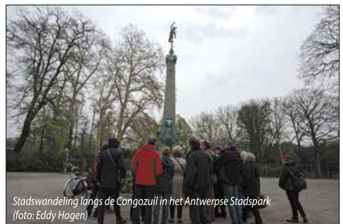
Stadswandeling langs de Congozuil in het Antwerpse Stadspark